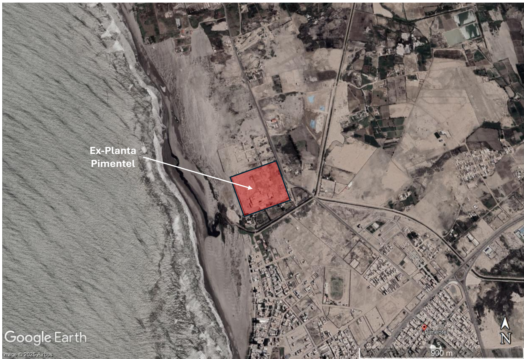
FOTOGRAFÍA REFERENCIAL MAR 2025 (GOOGLE EARTH)